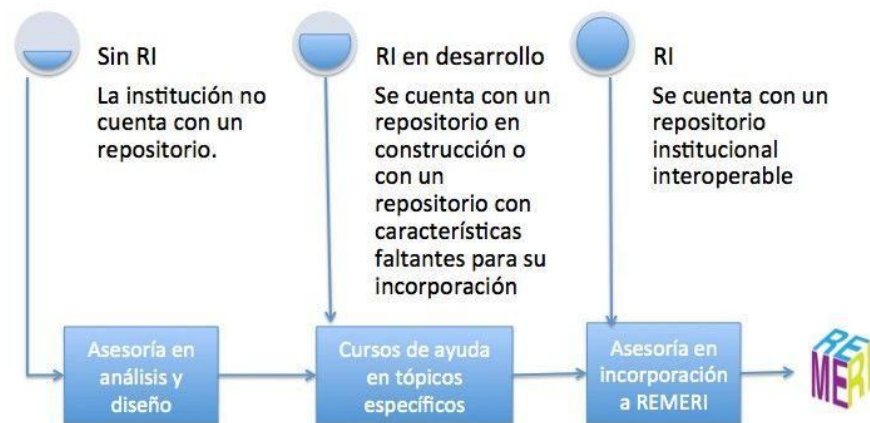
Figura 2. Esquema general de desarrollo de REMERI 1

Los miembros de la comunidad REMERI tienen estrategias que se pueden identificar en uno de tres posibles niveles de adhesión, lo cual se describe en la siguiente tabla: